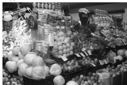
совместный выпуск правительства Ростовской области и нашей газеты

О необоснованном росте цен на мясную, молочную, рыбную и плодовоовощную продукцию можно сообщить на горячую линию департамента потребительского рынка региона: (863) 240 26 44. Чтобы помочь сотрудникам департамента, необходимо будет сообщить адрес и наименование торгового объекта, название продукта и его производителя.