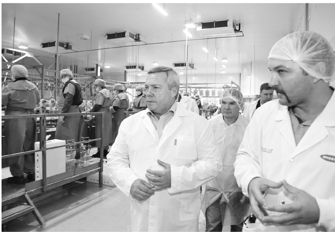
● Проектная мощность компании «Донстар» – 26 тысяч тонн мяса утки в год

В Тарасовском районе глава региона провел встречу с инвесторами крупнейшего в области тепличного комплекса по выращиванию овощей. «Донская усадьба» должна стать одним